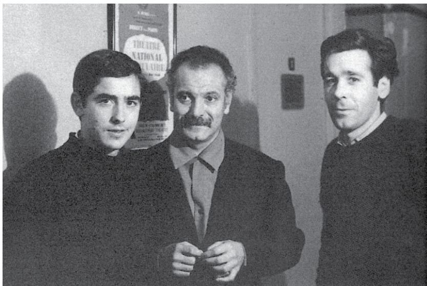
Serrat, Georges Brassens y Paco Ibáñez en 1966. Tres cantantes íntegros y claros en sus manifestaciones.

Tras ese primer disco de cuatro canciones llega en 1966 el segundo con «Ara que tinc vint anys», «Quan arriba el fred», «El drapaire» y «Sota un cirerer florit». Serrat figuraba en la portada con un rotundo primer plano, haciendo visibles sus inconfundibles lunares. En el tercer EP ya se deja ver con su guitarra, sedente, con los pies descalzos con la entrada en escena del gran Francesc Burull como arreglista, un músico polivalente, muy presente en la escena barcelonesa y adicto al jazz que imprime su sello en las primeras grabaciones de las míticas «Cançó de matinada», «Me'n vaig a peu» y «Paraules d'amor» que, junto a «Les sabates» (relectura en catalán a través de Delfí Abella de la nívea «Les souliers» de Guy Béart), formaban parte de este tercer disco del cantautor.