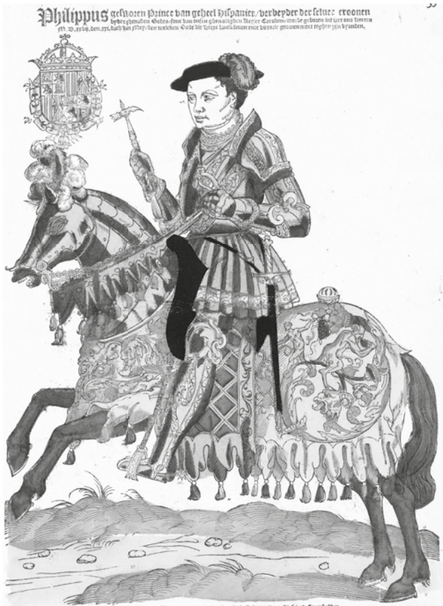
El príncipe Felipe a los 16 años. Xilografía de Cornelis Anthonijs, 1543. Rijksmuseum Amsterdam.